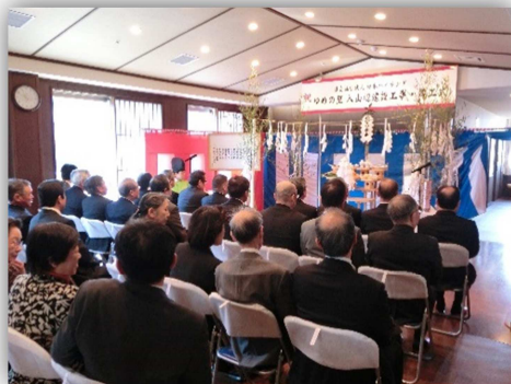
ゆめの里 入山辺竣工式