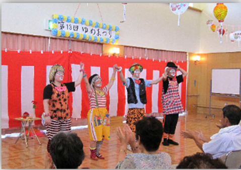
道化座ふーみんと職員3名によるピエロ で会場は笑っぱなし!

餅つきからはじまり、イベントはハイランドフラワーズのスコップ三味線、いなほの会による銭太鼓、道化座ふーみん、職員によるソーラン節。屋外ではJA和田支所の親子ひろばが開催され、大勢の皆様が来場されました。