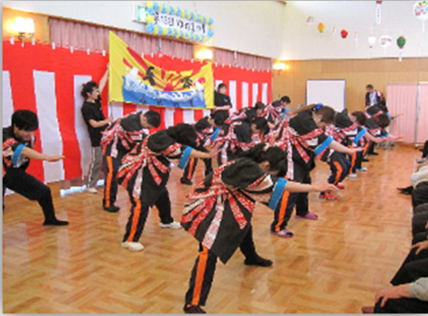
練習の成果が出た職員によるソーラン節