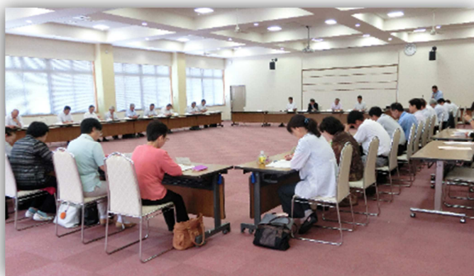
運営委員会にてH26年度の事業報告をしました

2ユニット(定員18名)の認知症対応型共同生活介護施設「ゆめの里 入山辺」を建設、27年3月に開所しました。また、懸案となっていた「教育研修体系」を策定し、計画的に人材育成を促進できる体制を整えるとともに「こころの相談室」の設置、腰痛予防等運動トレーニングの実施等職員の働く環境の整備にも努めました。