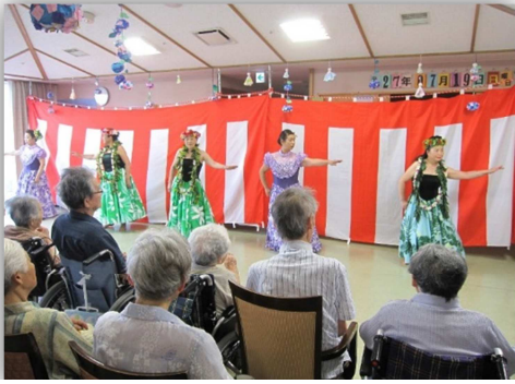
JA女性部のフラダンスでハワイアン〜

ゆめの里朝日では、7月19日に地域交流事業でもある「朝日ゆめまつり」を開催しました。お祭りには朝日村村長や地区長、運営推進委員等ご来賓をお招きし、地域の方も含め大勢の方にお越し頂きました。お祭りでは焼きそば、焼き鳥、スイカのふるまい、ヨーヨー釣りなどがあり、ホールではフラダンスの優雅な踊りが披露され、にぎやかなお祭りとなりました。